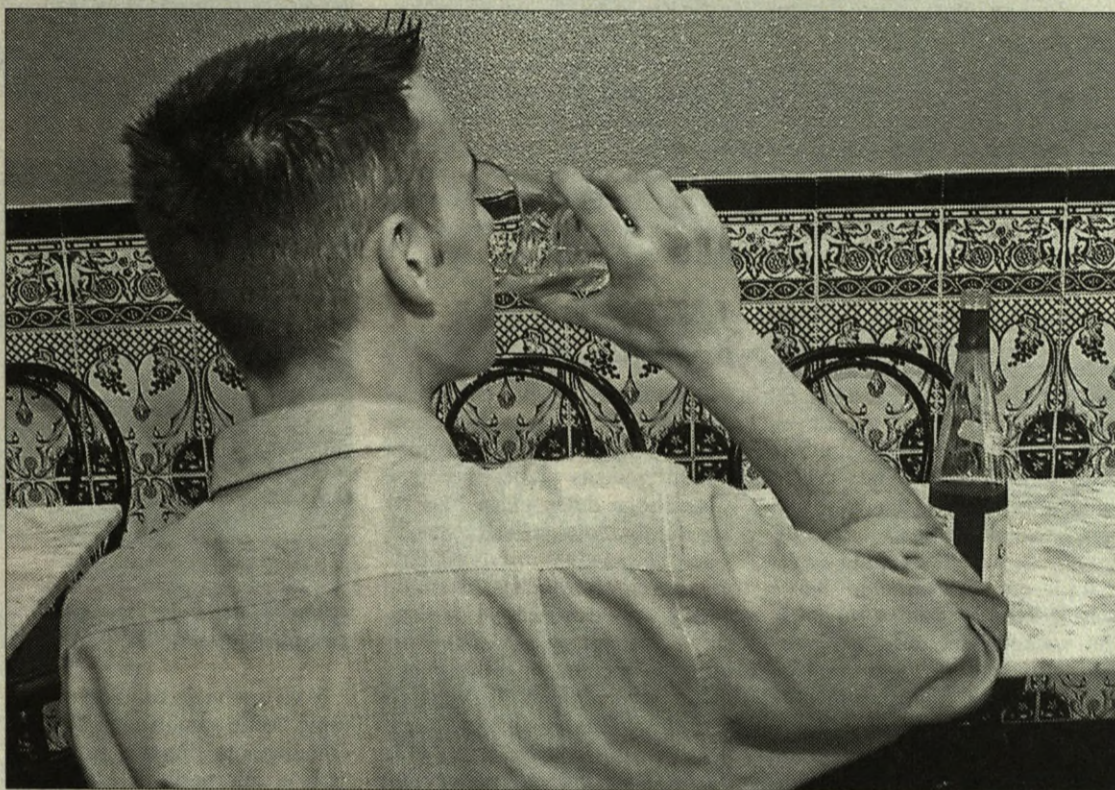
En los últimos años el número de jóvenes alcohólicos ha aumentado considerablemente

Ésta es una de las formas de llegar a Alcohólicos Anónimos, pero desde la agrupación, que lleva más de 30 años trabajando en Bizkaia, aseguran que cada caso es diferente, con una problemática particular. Sin embargo, en todos ellos llegaron a la con-